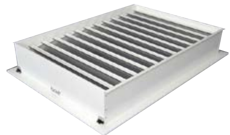
Elektrisch/pneumatisch bediende afsluitsectie